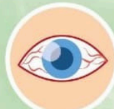
Conjuntivitis (ojos rojos)