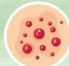
Erupción rojiza en la piel

⚠ Puede causar complicaciones graves como neumonía o inflamación del cerebro.