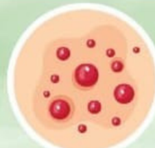
Erupción rojiza en la piel

⚠ Puede causar complicaciones graves como neumonía o inflamación del cerebro.